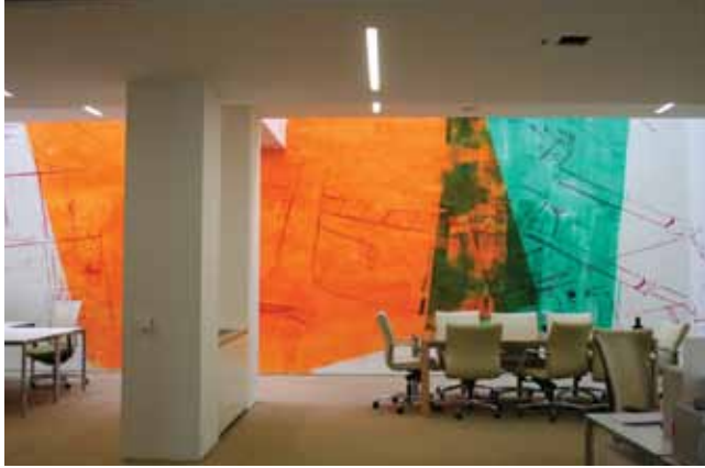
Resim 1: Paul Schwer, İsimsiz, 2007, Perili Köşk için duvar resmi, Detay (2010 yılında üzeri boyanmıştır) Resim: Sanatçı

Çalışmalarını Düsseldorf'ta sürdüren Paul Schwer, 2007 yılında Borusan Contemporary için bir duvar resmi gerçekleştirmişti. Perili Köşk'ün dördüncü ve asma katlarını kapsayan bu büyük boyutlu çalışma (RESİM 1) nedeniyle birçok kez İstanbul'a gelen sanatçı, her ziyaretinde çekmiş olduğu fotoğraflar ve yaptığı desenlerle görsel bir bellek oluşturmuştu. Spot On #6, Paul Schwer'in bu bellekten hareket ederek oluşturduğu, Borusan Çağdaş Sanat Koleksiyonu'na yeni katılan ve daha önce hiçbir yerde sergilenmemiş olan çalışmalarını kapsamaktadır.