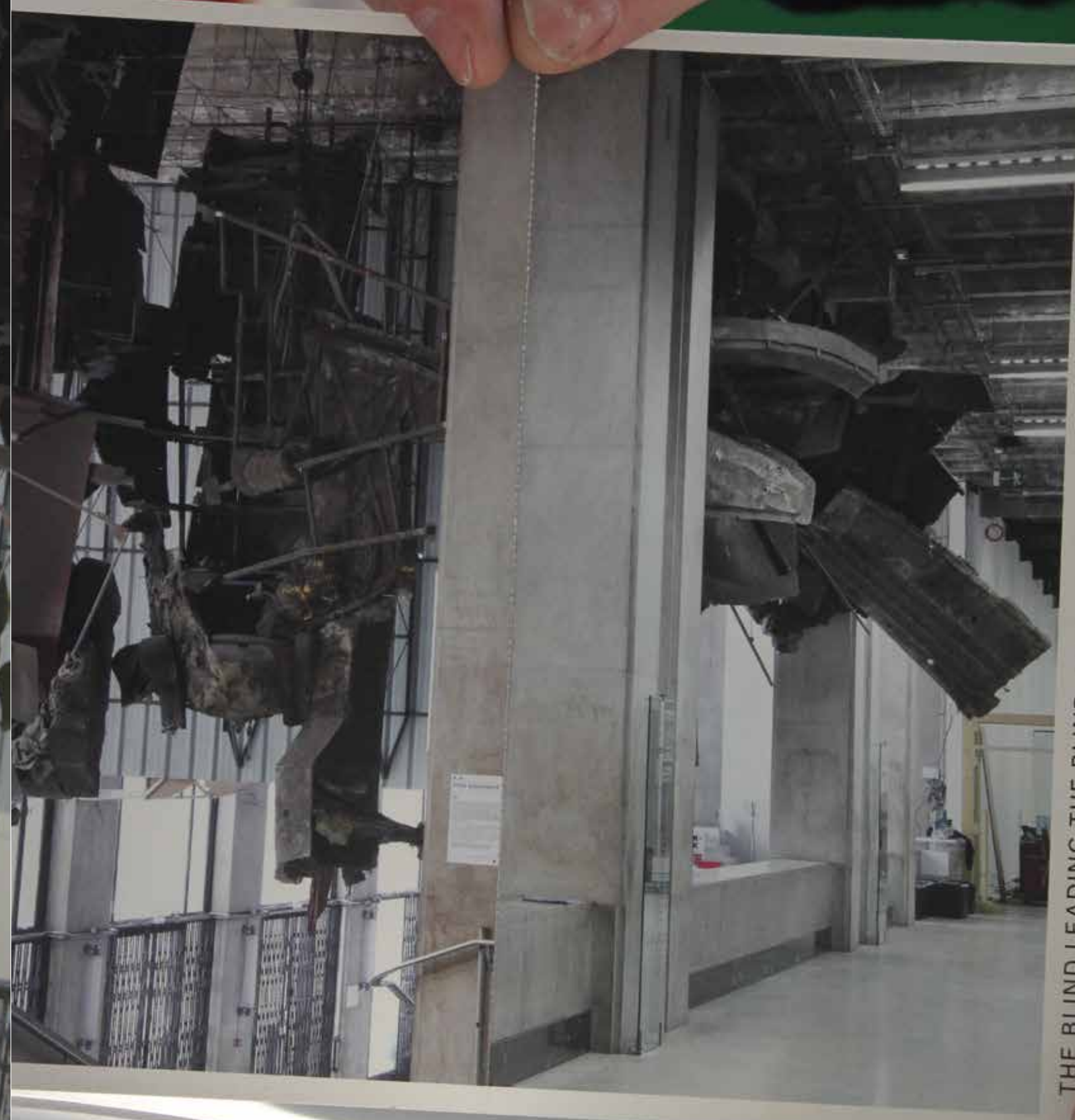
THE BLIND LEADING THE BLIND, 2012