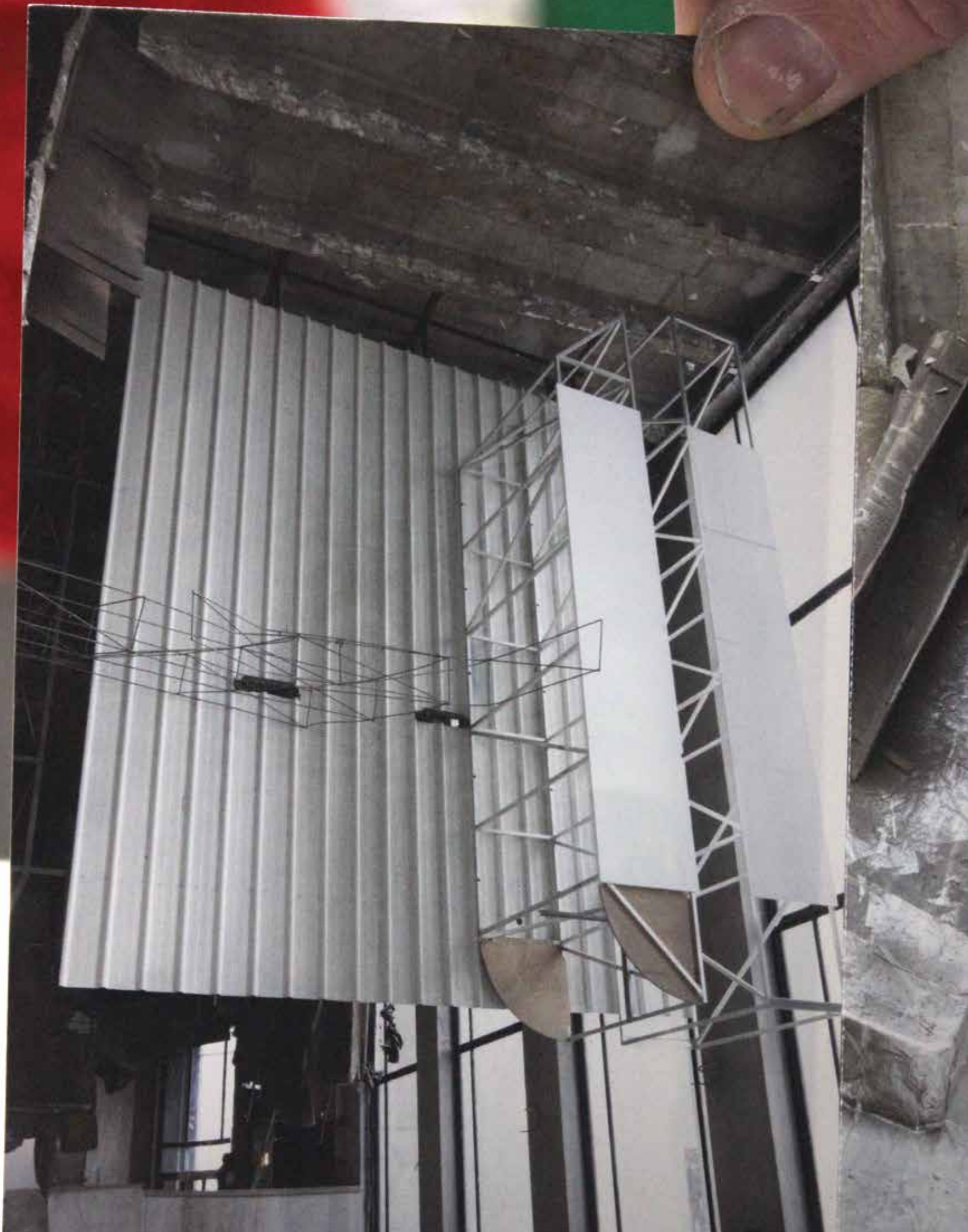
Peter Buggenhout "The Everchanging Repetition" 2016