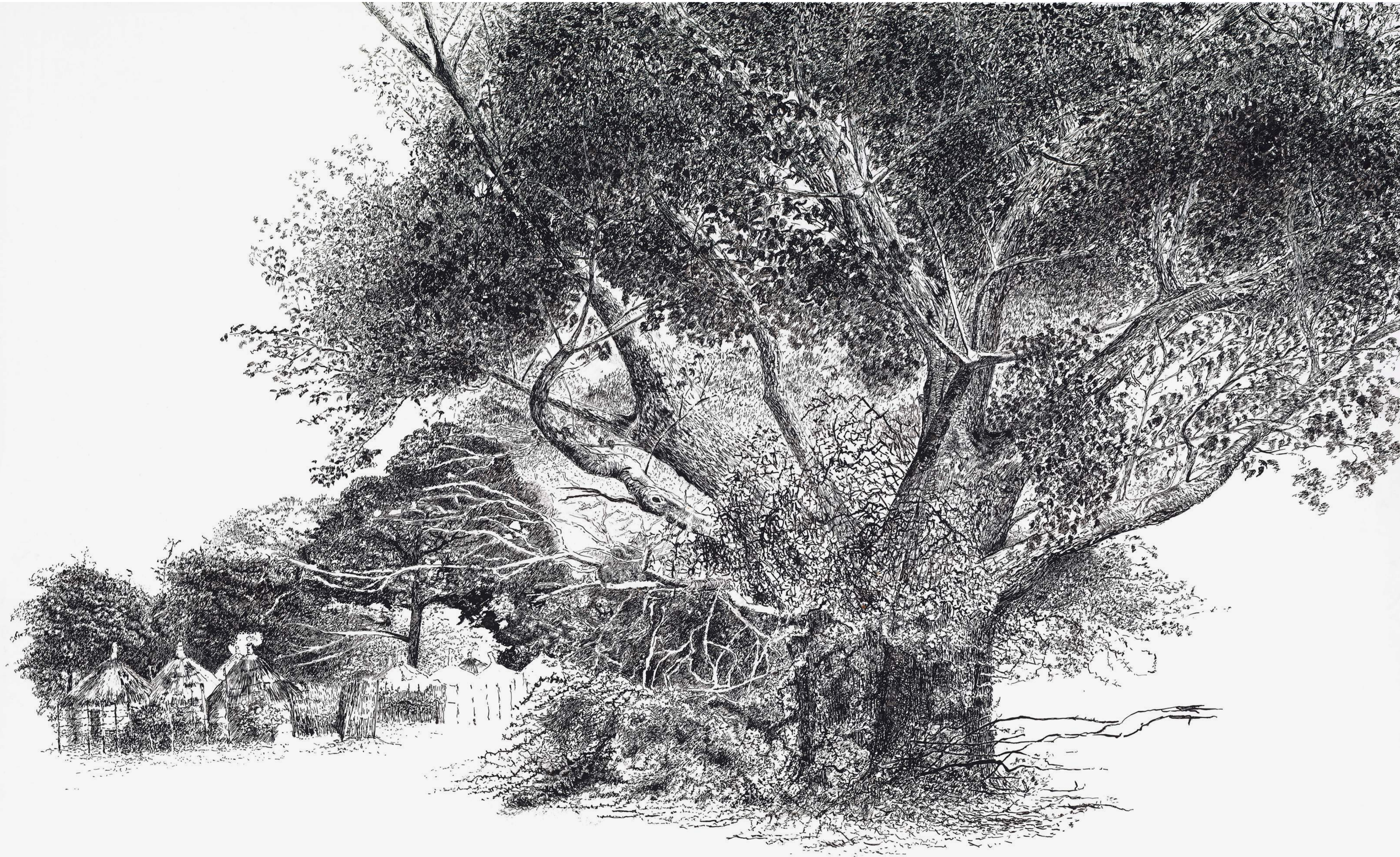
736. SENEGAL - DIAHAW - Residence du Roi du Sine