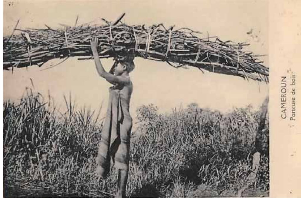
Vintage postcard, 14,8 x 10,5 cm