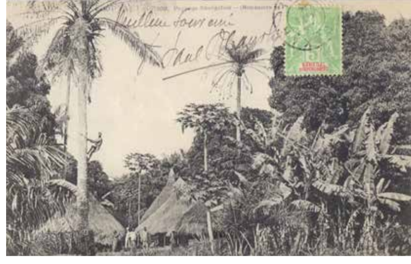
Vintage postcard, 14,8 x 10,5 cm