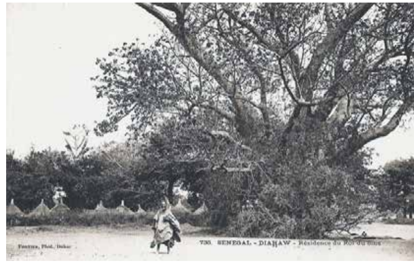
Vintage postcard, 14,8 x 10,5 cm