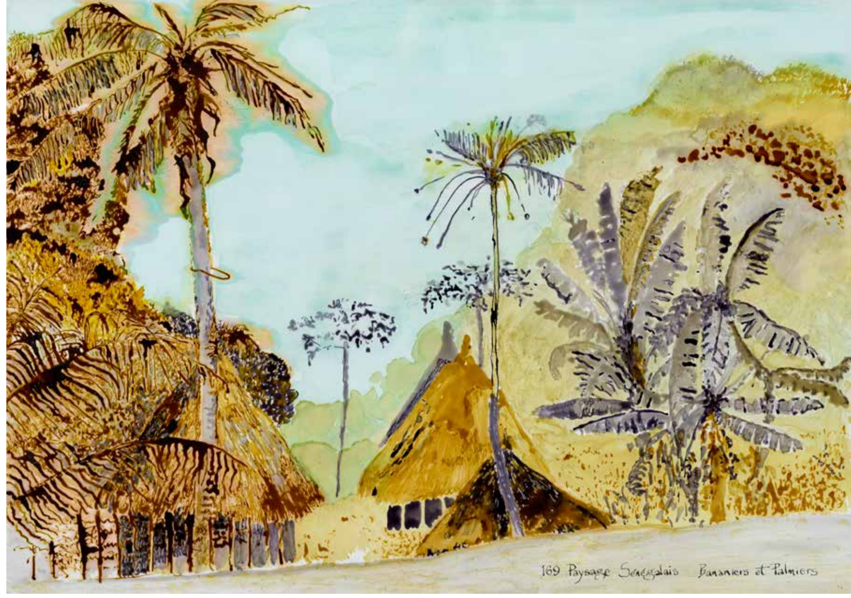
Sue Williamson, Banana and palm trees, Senegal, 2021 , ink on paper, 53 x 63 cm