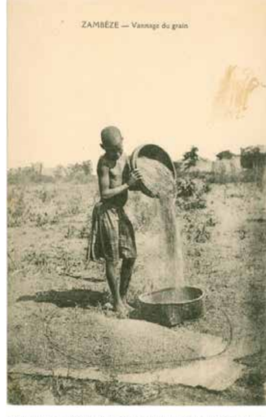
Vintage postcard, 14,8 x 10,5 cm